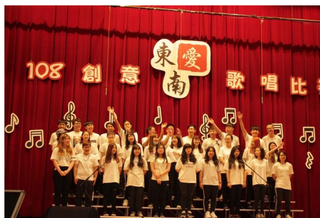
圖 2: 一年級學生比賽