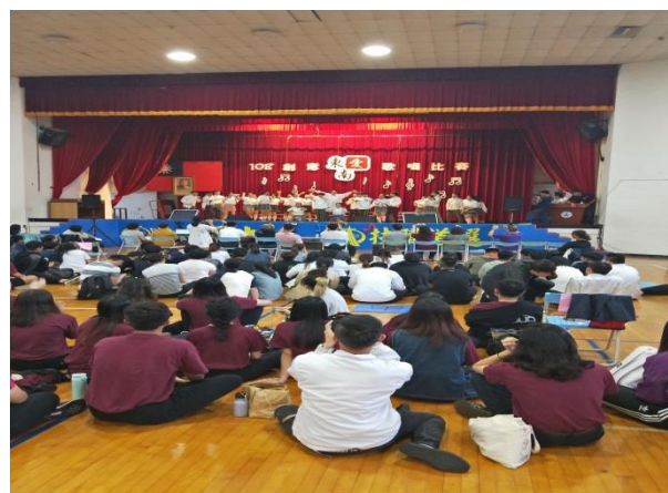
圖 4: 表藝系上場比賽