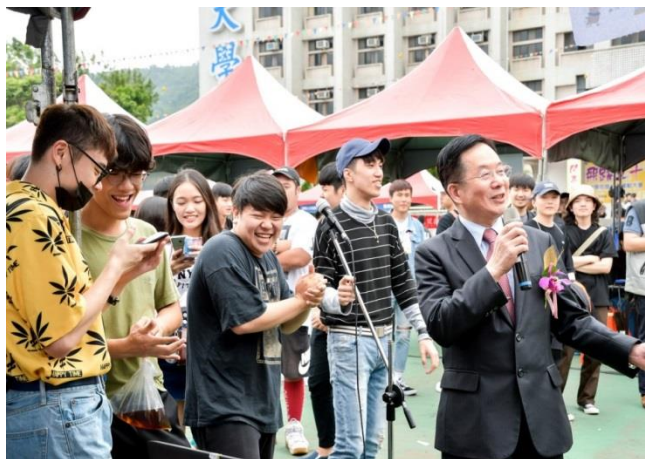
圖 1: 校長親臨園遊會