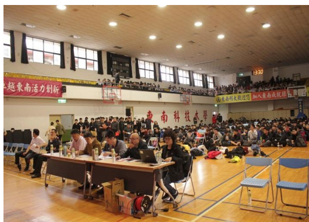
圖 3: 辛苦的裁判