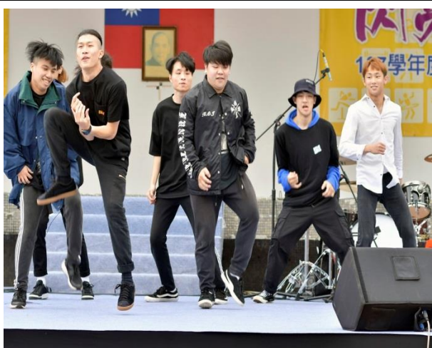
圖 3: 熱舞社舞蹈表演