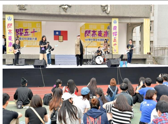
圖 4: 熱音社表演