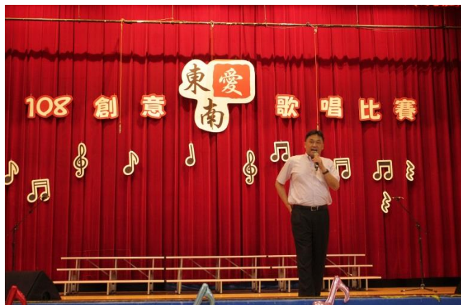
圖 1: 董副校長主持創意歌曲比賽