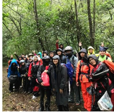
大合照 - 2