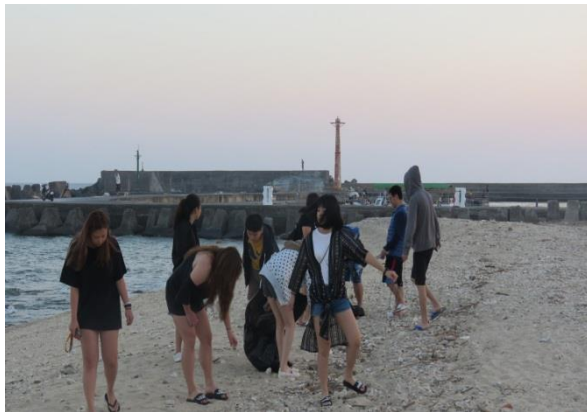
社員們彎腰撿拾垃圾