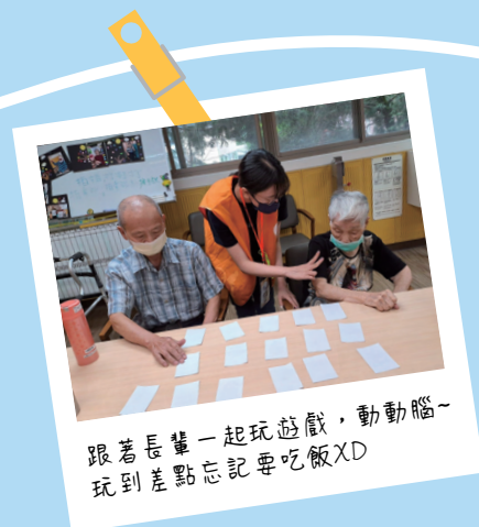
跟著長輩一起玩遊戲，動動腦~ 玩到差點忘記要吃飯XD