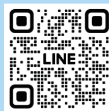
伊甸服務學習營隊LINE

如果想要了解更多， 可以加入伊甸服務學習營隊LINE：@rch0717a 隨時會有營隊的最新消息等著您！