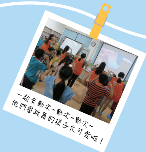
一起來動次~動次~動次~ 他們學跳舞的樣子太可愛啦!

從身心障礙者就學、就業等權益倡導，進而到發展遲緩兒童的早期療育服務、高齡長者的照護.....等，提供身、心、靈的全人社會福利服務，讓福音與福利得以實踐。